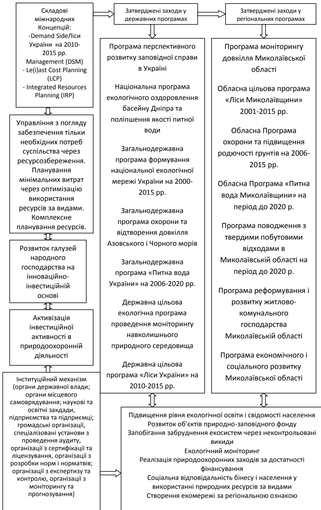
Рисунок 1 – Складові еколого-орієнтованого підходу формування і використання природно-ресурсної основи розвитку аграрного сектора економіки