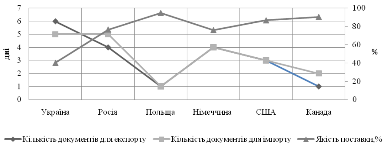
Рисунок 1 – Витрати часу на документальне митне оформлення та якість поставок підприємств України, 2014 р.

сертифікування і транспортування продукції до порту на «Франко борт» є підставою стверджувати про недостатній рівень розвитку аграрної логістики в Україні порівняно з провідними країнами світу (рис.1). Так, за індексом ефективності логістики (LPI – Logistics Performance Index) [4], який розраховується Світовим банком, Україна у 2014 р. посіла 61 місце серед 160 країн світу із загальним показником 2,98 балів із 5 можливих (на першому місці знаходиться Німеччина з показником 4,12 балів).